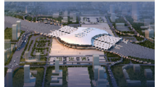
乌鲁木齐高铁火车站夜景效果图

近年来受到世人瞩目的一些建筑工程项目因为应用了BIM而显得分外夺目，它们的诞生不单纯取决于设计，却收获了巨大的成功。叶炜认为，“BIM应用的最终受益方是业主，它的存在降低了工程实施的风险，这也来自于国内外普遍相信的一个观点——在真正房子盖之前，先在计算机里面盖了一遍，很多原本不可预料的风险都可以预知，这使得相关决策也变得更为容易。”