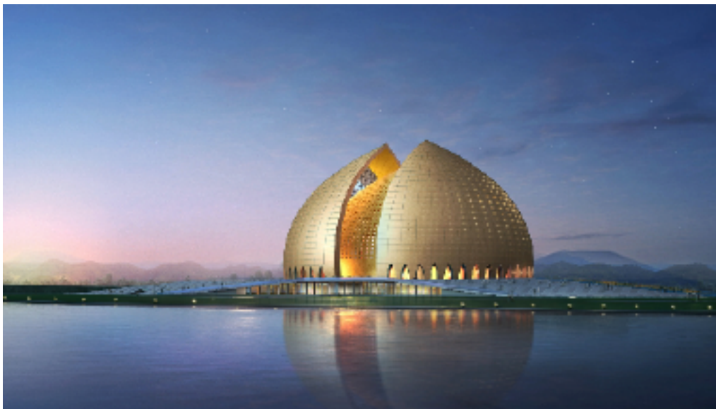
新疆大剧院效果图

深圳市建筑设计研究总院有限公司始建于1982年，伴随着深圳经济特区的发展而不断成长。深圳市建筑设计研究总院有限公司北京分院（“深北院”）成立于2003年。深北院下设创作中心、规划设计所、建筑所、结构所、机电所、BIM研发推广部、项目管理部、质量管理部、财务部、大营销部、人事行政部等10个部门。专业技术人员130余人。从事各类工业及民用建筑设计、装饰工程设计、城市规划编制、项目前期可研、市政道路与环境景观设计，涵盖项目前期策划、可研编制、建筑方案及规划设计、施工图设计直至景观外线的全程设计服务，公司业务立足北京，并辐射至天津、河北、山东、内蒙、新疆及整个华北地区。连续三年荣获深圳总院颁发的“优秀设计院(所)”荣誉称号。