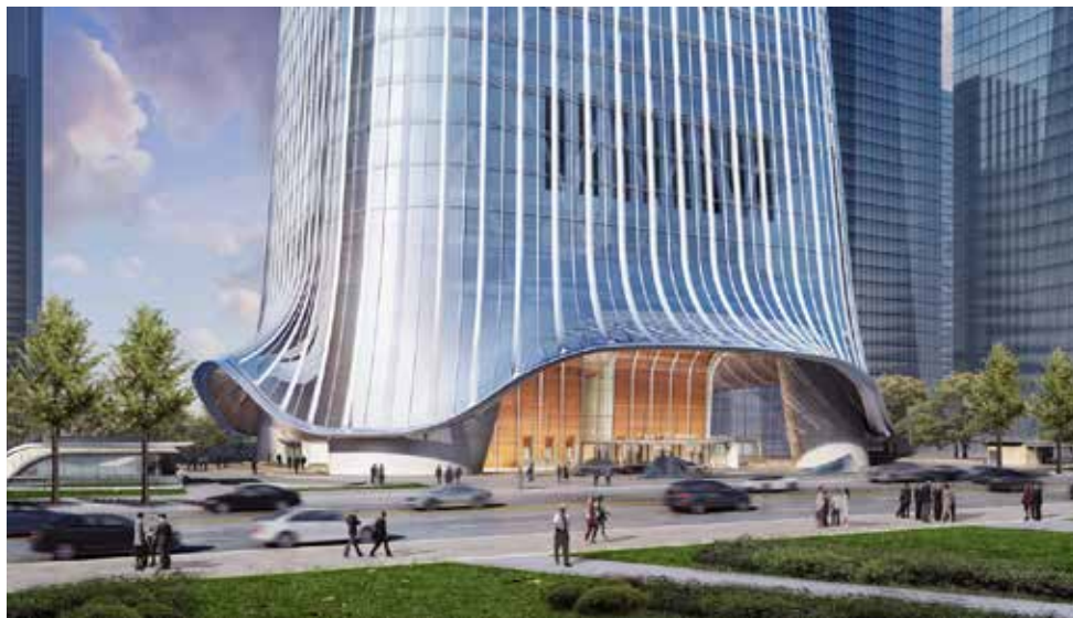
中国尊塔楼底部效果图

BIM技术能够帮助建筑师、设计师实现他们的创作灵感，同时支持他们挑战传统工作模式。