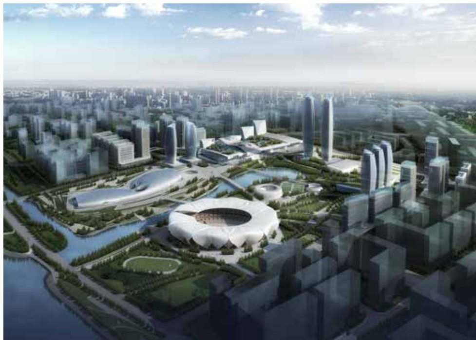
杭州奥体中心体育游泳馆鸟瞰图

不仅如此，在建立BIM模型过程中，采用全程参数化方法，是该项目的一大突破。用这一设计方法，将造型建立在全数学逻辑上，不仅可自动生成造型，还可调整参数，对造型和各部件进行修改，实现对造型的自如推敲。总结而言，数学领域在建筑上应用的前景广阔，利用参数化平台，未来设计中更可能引入更多其他