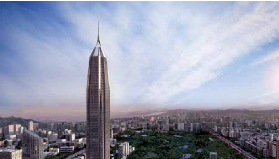
深圳平安金融中心效果图

中建三局第二建设工程有限责任公司安装公司（简称“安装公司”）成立于1954年，隶属中建三局第二建设工程有限责任公司，是世界500强企业的重要成员，是机电专业的国家大型一级施工企业。公司总部位于中国东湖高新区的光谷腹地——武汉，目前已形成了华中、华南、东北、京津、华东、西南、西北等中心城市为辐射的经营生产格局，下设11个分支机构和沈阳恒隆直属项目部，在建项目124个，其中大型、特大型项目36个。安装公司现有员工人数1200人，其中具有中、高级职称237人，取得注册执业资格证81人。