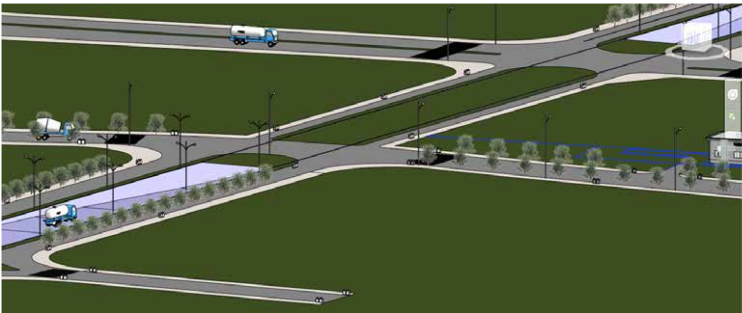
基于BIM的全内容建模

未来，BIM技术将大大推动行业生产的综合提升，对生产关系产生深刻影响，促进一些新的建设模式发展，催生一些基于BIM服务的新行业。