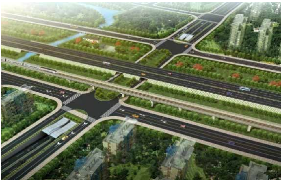
陈翔路地道鸟瞰效果图

Autodesk Revit系列专业建模软件和Autodesk Ecotect等分析软件不仅在民用建筑中包打天下，也同样适用于市政工程建设。