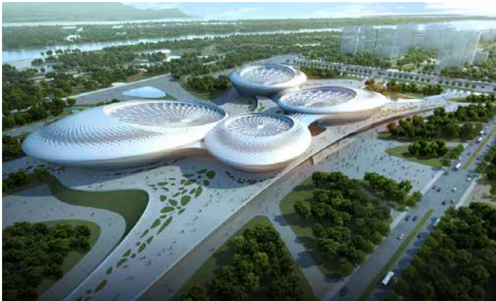
江苏大剧院鸟瞰效果图

华东建筑设计研究总院（“ECADI”或“华东总院”）是国内最早成立的大型设计公司之一，拥有悠久的历史、深厚文化底蕴和国内外众多标志性建筑项目的设计和管理经验，在民用建筑领域拥有几十年的领导者地位。