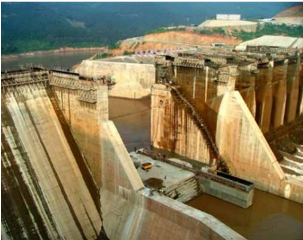
园水电站项目实景图

中国水电顾问集团昆明勘测设计研究院（简称“昆明院”）成立于1957年，拥有超过1500名的员工，是具有工程设计综合甲级资质的大型勘测设计科研单位，主要从事国内外水利水电、风电、太阳能发电以及市政工程的勘察、设计、科研、咨询、监理和总承包等业务，具有国家授予的勘察、设计、总承包、监理等多项甲级资质，持有国家甲级环保、水保、造价、水资源评价、安全评价、勘测定界以及工程项目管理、对外承包工程经营等专项资质证书近40项，通过了中国CNACR和国际UKAS质量认证，是中国国际工程咨询协会、中国工程咨询协会和国际咨询工程师联合会会员单位，并由外经贸部授权对外开展经济技术业务合作，在全国水利水电勘测设计单位中处于领先地位，是中国勘察设计综合实力百强之一，云南省勘察设计单位综合实力五十强第一名，累计承担了国内外大、中、小型水电站工程400余座。