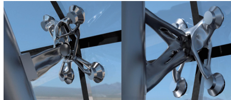
位相最適化に関する研究にてジェネレーティブ デザインを使用し実現したファサード