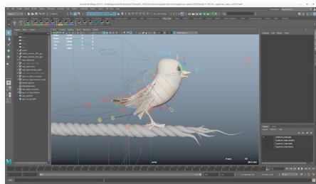
Технические сцены в Autodesk Maya.