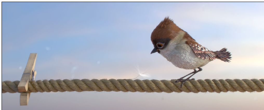
Кадр из анимационного фильма «Чик-Чирик».

Пайплайн анимационного фильма «Чик-Чирик» на основе Autodesk Maya и Houdini