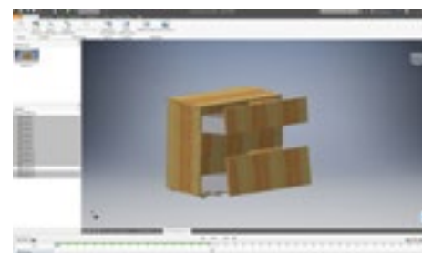
Projekt wykonany przez Black Red White z wykorzystaniem rozwiązań Autodesk

— Paweł Jurkowski Z-ca Dyrektora Handlowego Ds. Badawczo-Rozwojowych