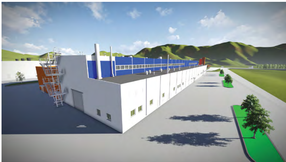
Модель «Ремонтно-механических мастерских Быстринского ГОК», выполненная в Autodesk Revit

Переход на информационное моделирование как способ повысить качество проекта