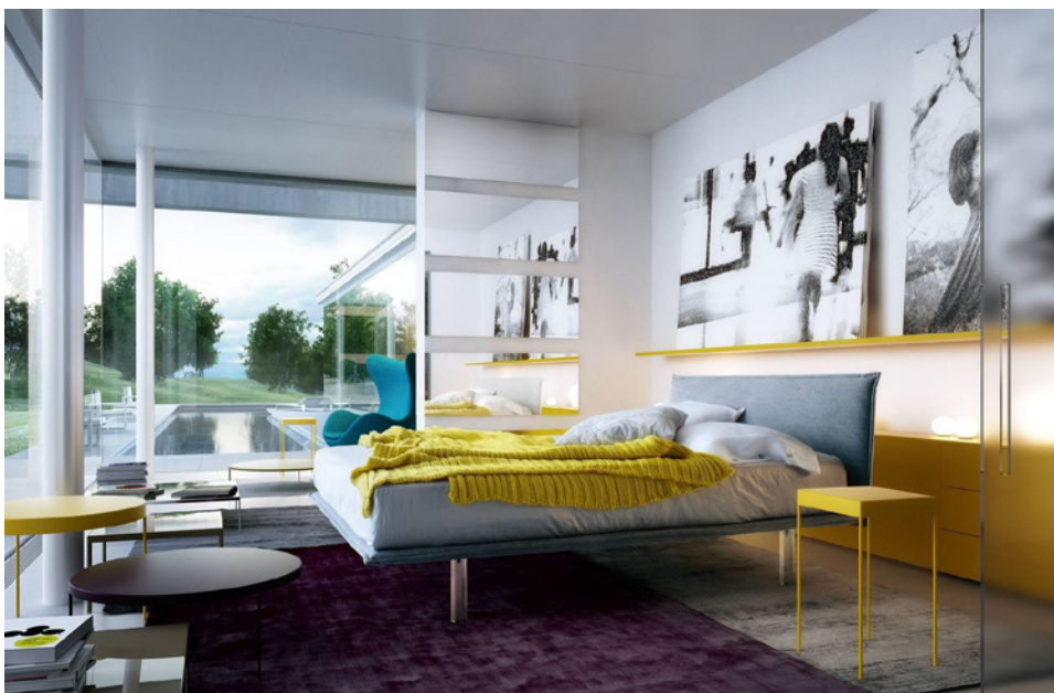
Immagini gentilmente concesse da Nudesign