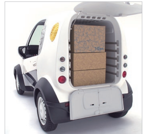
通常使われている配送用段ボールがきちんと収納できるように、荷室も最適化した。