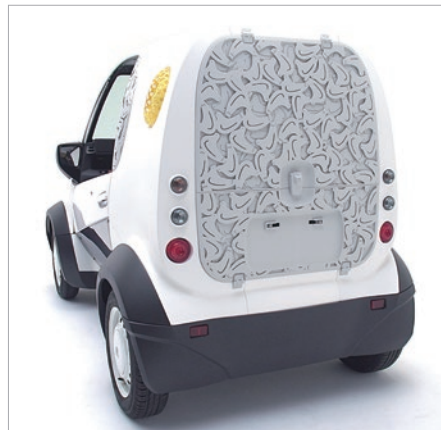
愛らしい鳩が重なり合ったバックドアの造形は、3D プリンターでしか実現できない重層的なデザイン。