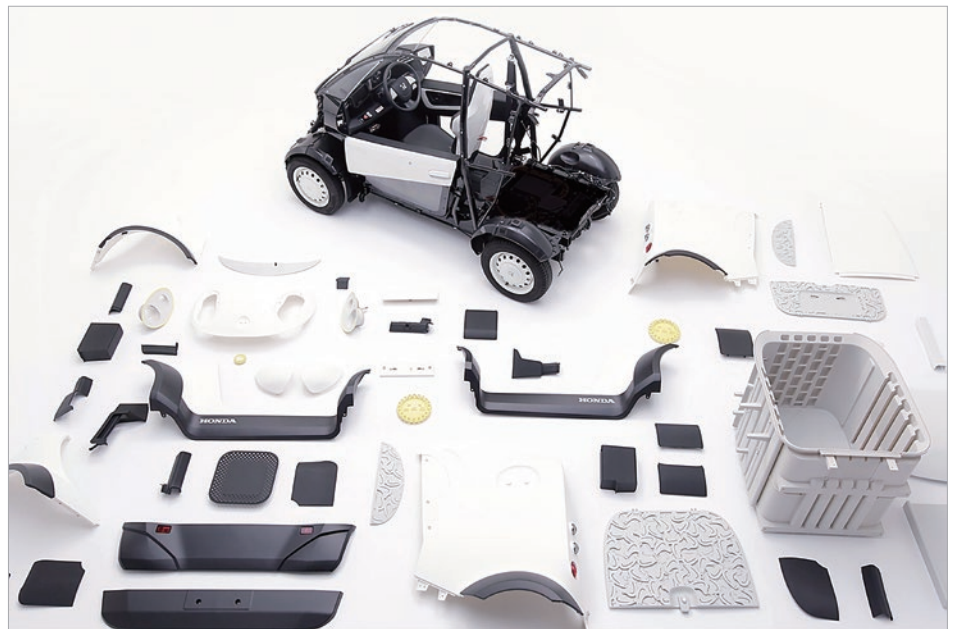
超小型 EV の骨格 (写真上) 以外、ほぼすべての外装を 3D プリンターによって製造。素材にはハイグレードの ABS 樹脂を採用した。

Autodesk, Autodesk ロゴ, Fusion 360 は、米国および/またはその他の国々における、Autodesk, Inc., その子会社、関連会社の登録商標または商標です。その他のすべてのブランド名、製品名、または商標は、それぞれの所有者に帰属します。オートデスクは、通知を行うことなくいつでも該当製品およびサービスの提供、機能および価格を変更する権利を留保し、本書中の誤植または図表の誤りについて責任を負いません。 ©2017 Autodesk, Inc. All rights reserved.