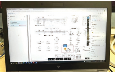
在宅勤務でチームワークによる設計を円滑に行える「指摘事項」機能。設計上の課題をどのように解決したのかという履歴が残り、関係者全員に共有できる

また、コロナ禍で増えた在宅勤務もスムーズに行えるようになった。以前は大量のデータを自宅で処理するために、パソコンにコピーして持ち運ぶという手間ひまがかかっていたが、今はDocs上でのやりとりだけで済むようになった。