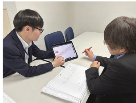
Docsとタブレットさえあれば、客先でも必要な図面やBIM/CIMモデルにいつでもアクセスし、効果的なプレゼンテーションが行える

また、若手社員からは、社外のパートナーともプロジェクトのデータを共有しながら、スピーディーな協業を行う業務スタイルについての提案も出ている。社内だけにとどまらない生産性向上が追求できるのも、Docsの魅力と言えるだろう。