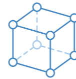
설계에 대한 해석과 시뮬레이션 수행

InfraWorks, Civil 3D, Revit, Structural Bridge Design