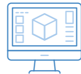
컨셉 설계에서 상세 설계로의 전환

프로젝트에 대한 예비 컨셉 배치를 신속하게 수행한 후 상세 설계로 넘어가 설계 모델에 훨씬 정밀한 세부 사항을 추가하십시오. 교통 프로젝트에서 이러한 도구를 사용해 도로 선형을 효과적으로 설계하고 회전 차선, 교차로 및 고가 도로를 손쉽게 추가할 수 있습니다. 전문 분석 도구는 주차장 공간과 도로 스타일을 검토해 주차 공간의 수를 결정하여 예비 구획 배치 컨셉을 개선할 수 있도록 지원합니다. 또한 이 워크플로우는 교량 구조의 계획, 설계, 구조 분석을 더 쉽게 향상할 수 있도록 합니다.