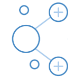
분야 간 협업 개선

InfraWorks, Civil 3D, Revit, Navisworks, Vehicle Tracking