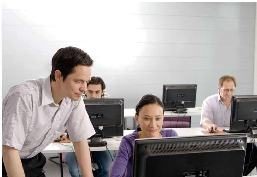
Autoryzowane Centrum Certyfikacyjne (ACC®)

Projektanci polskiego oddziału PM Group – firmy projektowej i zarządzającej realizacją inwestycji – uzyskali certyfikaty potwierdzające znajomość oprogramowania Autodesk w ramach programu certyfikacji zainicjowanego w październiku 2011 roku.