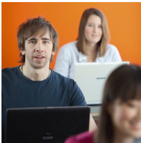
Autoryzowane Centrum Certyfikacyjne (ACC®)

Aby dowiedzieć się więcej o programie certyfikacji Autodesk prosimy odwiedzić stronę www.autodesk.pl/certification